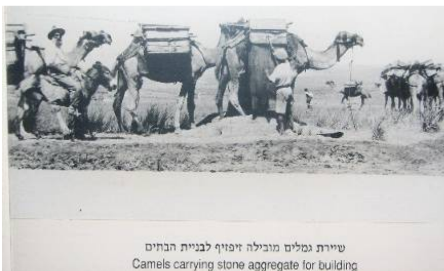
שיירת גמלים מובילה זיפזיף לבניית הבתים Camels carrying stone aggregate for building

נראים חלוצים כשאחד מהם שותה מים כמו הערבים מהכד ואישה נושאת כד מים על כתפה. מעל תמונה זו הכיתוב המספר על אספקת המים למתיישבים ע"י הערבים מג'ליל. הכיתוב באנגלית מגלה משהו שהכיתוב העברי מבליע: הוא מבחין בין מתיישבים או מתנחלים – SETTLERS – לתושבים (ערבים) – RESIDENTS. גם חומרי הבנין הובאו מג'ליל, הכפר השכן. פליט הכפר אברהים אבו סנינה סיפר על משפחתו שעסקה בכריית חומר בנין והובלתו מהמקום בו נמצא כיום הסינמה סיטי 14 . תמונה יפה מראה גמלים מובילים זיפזיף לבניה