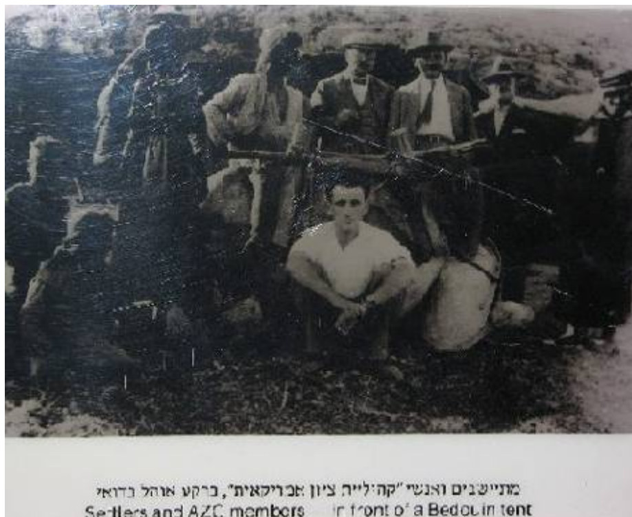
מתיישבים ואנשי "קהיליית ציון אמריקאית", ברקע אוהל בדואי Settlers and AZC members in front of a Bedouin tent

בד"כ יחסי "אחים" כאלה מבקשים להוכיח עד כמה היו היהודים טובים אל ערביי הארץ. זאת בלי לשים לב לעובדה שלמעשה יחסים אלה מוכיחים שרוב תושבי הארץ, הערבים, אכן התייחסו בד"כ בנדיבות אל המיעוט היהודי שהיגר אליה. התמונה שעליה אבקש להתעכב במיוחד מופיעה