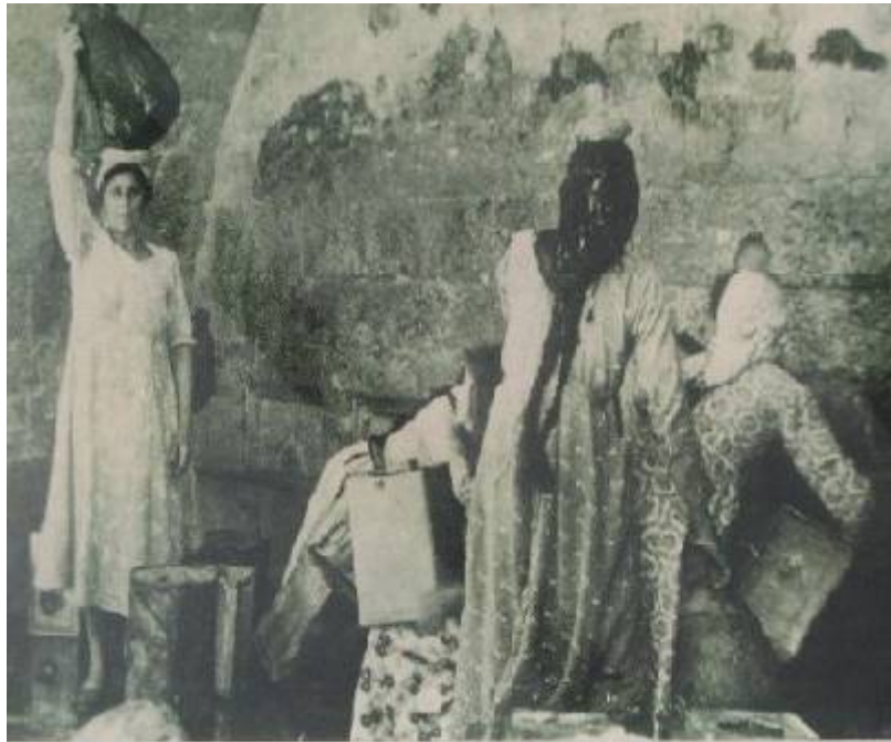
בדואיות מאזור סידנא עלי שואבות מים מהבאר שבמסגד

יחסי גינדר משתקפים היטב בתמונות המוצגות. תמונה מראה נשים "בדואיות מאזור סידנא עלי שואבות מים מהבאר שבמסגד" 15 .