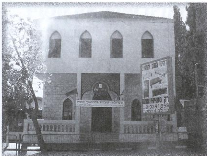
בית העיריה הישן בית البلدية القديم

الشرقية باتجاه القدس قرب سكة الحديد . مقبرة النبي صالح .