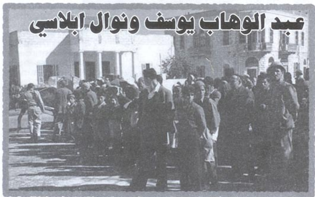
לפני הגירוש קיבל התהجير

בשנת 1936 היתה מלחמה, האנגלים שלטו בארץ. האנגלים היו פושטים כלילה על בתי המכובדים ועוצרים אותם, שואלים האם יש שם מורדים או מתנגדים.