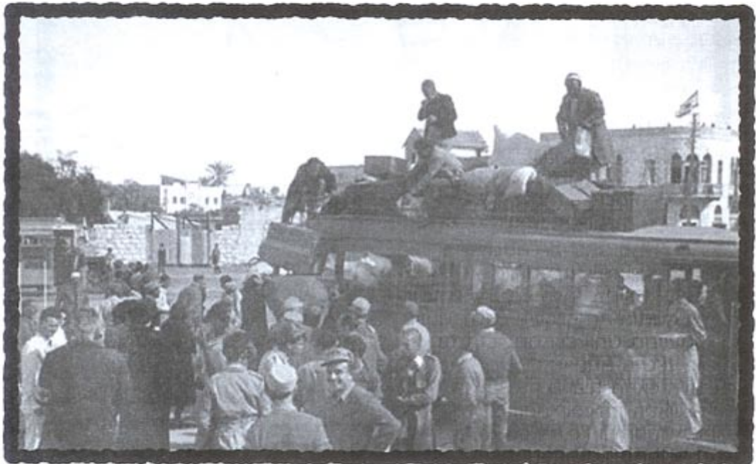
ירוש מאורגן באוטובוסים طرد منظم بالباصات

באפריל 1948 התקרבה המלחמה לרמלה, לאחר שבקרבות שהתחוללו מאז דצמבר 47, כבש ארגון ה"הגנה" את הכפרים חירייה, סקיא ויאזור. כיבוש זה העצים את הפחדים של