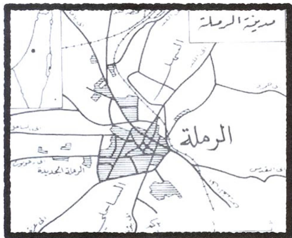
מפת רמלה. خارطة الرملة

في عام 1948 كانت مدينة الرملة تعتبر مفترق الطرق الرئيسي في وسط البلاد، حيث كانت تربط بين مدينتي يافا والقدس، والشارع الداخلي فيها كان يربط كذلك بين شمال البلاد وجنوبها. تقع مدينة اللد على مسافة ثلاثة كيلومتر شمالي مدينة الرملة، إذ كانت هذه المدينة تعتبر مفترق السكك الحديدية الرئيسي في فلسطين. هاتان المدينتان كانتا داخل حدود الدولة العربية حسب قرار التقسيم، وأهميتهما بالإضافة الى ما ذكر هي قربهما من مدينة يافا والتي كان يجب ان تبقى منطقة عربية داخل اراضي الدولة اليهودية.