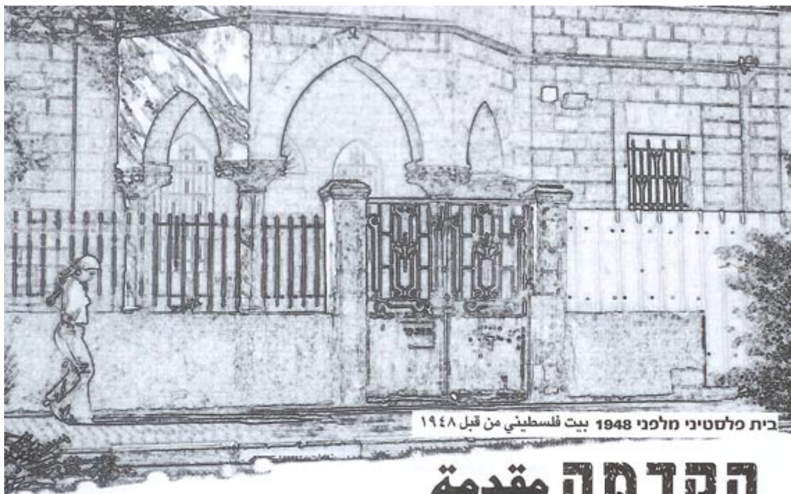
בית מלסטיני מלפני 1948 בית פלסטיני מן קבל 1948