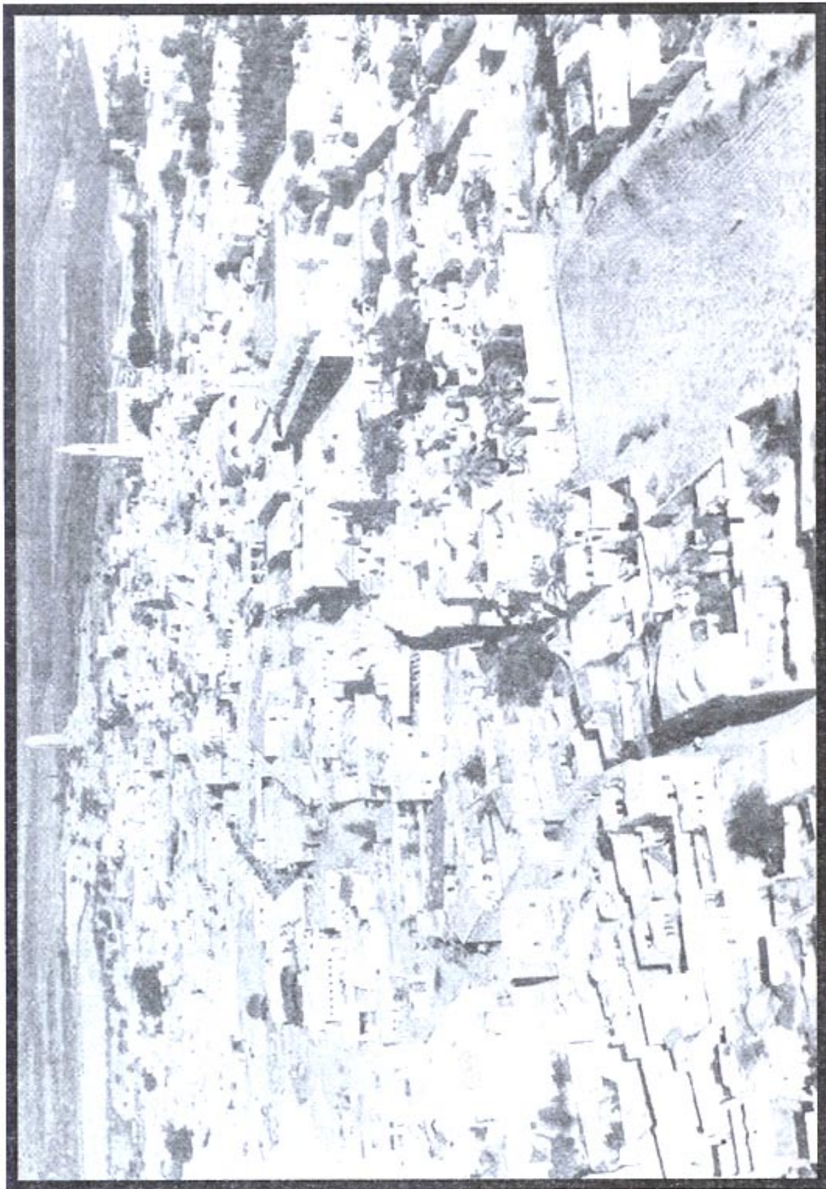
רמלה 1948 الرملة ١٩٤٨