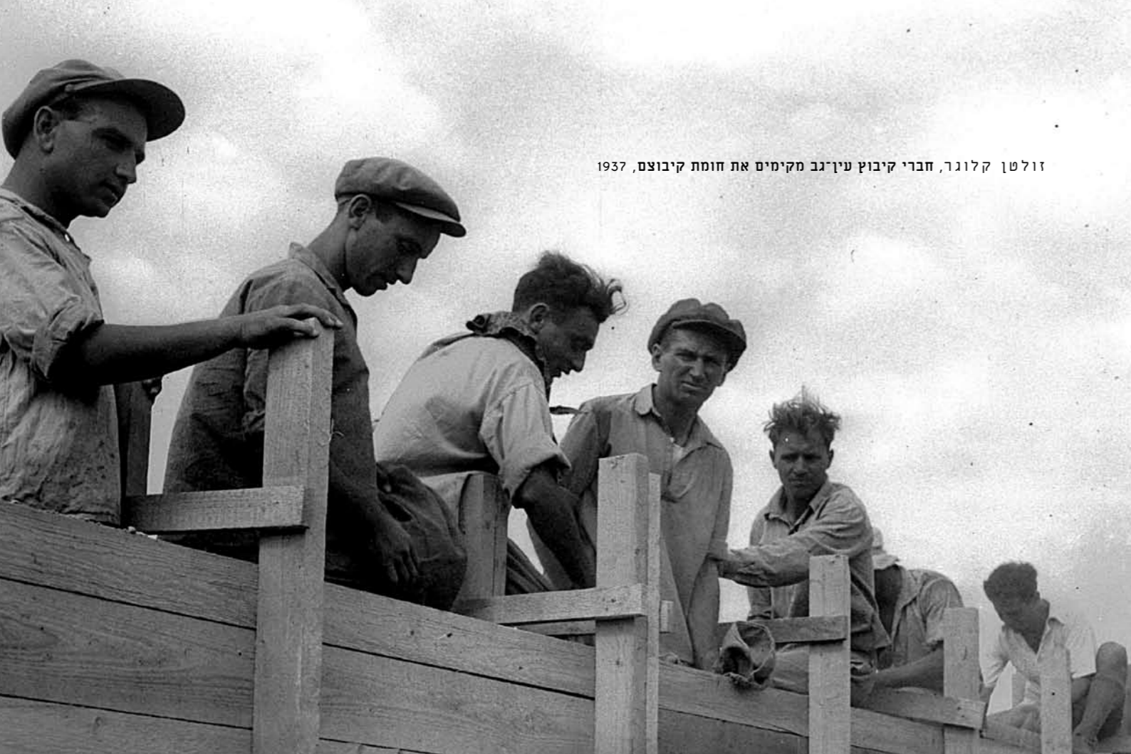
1937 | קלוגר, חברי קיבוץ עין-גב מקימים את חומת קיבוץ, 1937