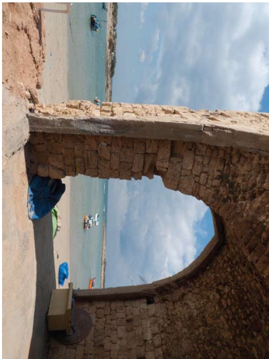
בית המכס במעגן אלטונטורה // בית الحمامים في مرسى الطنطورة