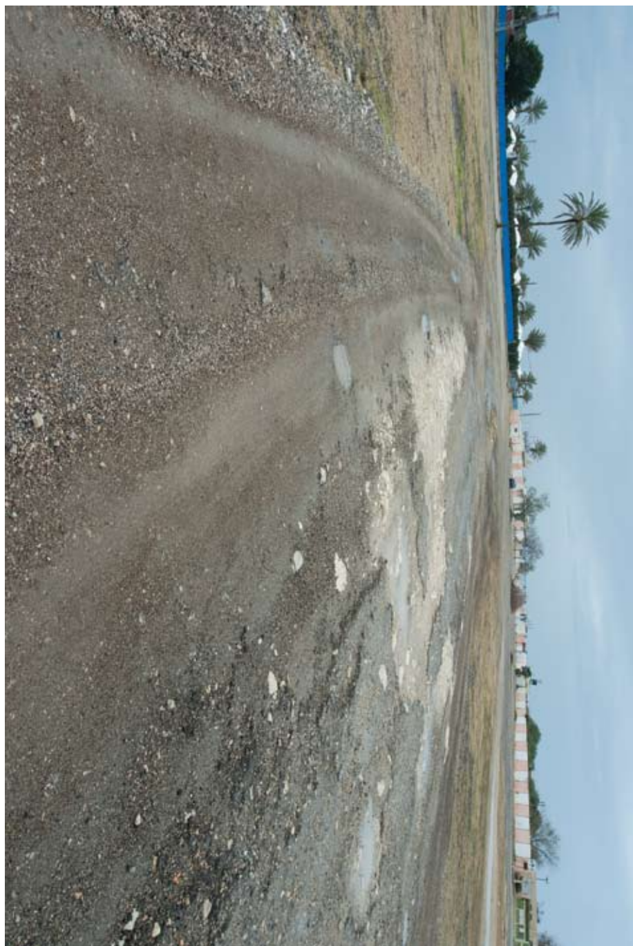
מגרש החניה בחוף דור/טנטורה // מוקף السيارات في شاطئ دور/الطنطورة