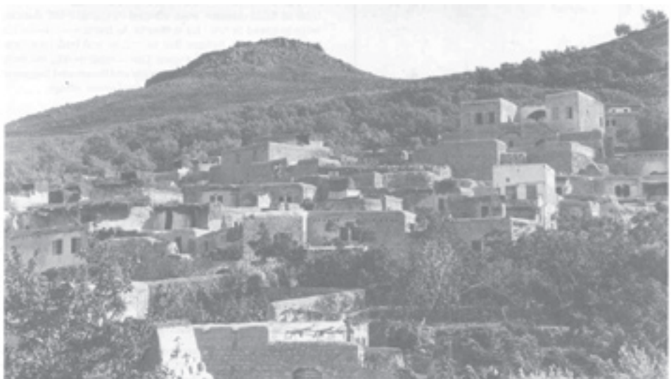
The village of Hitin. (1934)